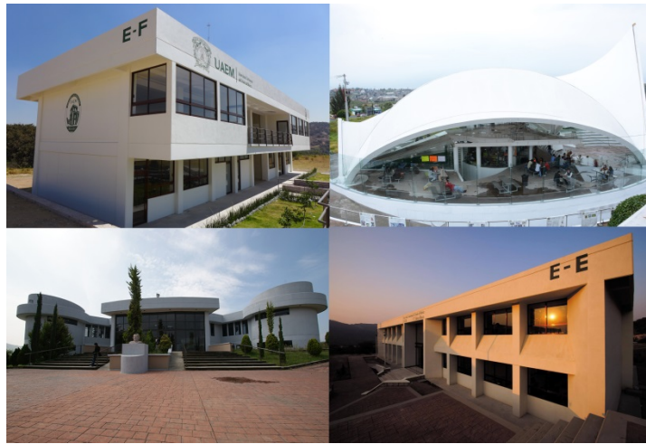
2. Edificios F; Pabellón Universitario; Biblioteca Justo Sierra y Edificio E

Los aumentos de la infraestructura han marcado los diferentes símbolos utilizados para representar a la comunidad de Valle de México. Uno de los primeros símbolos, cuando aún era la Unidad Académica Profesional Valle de México, fue el que se basó en la Biblioteca Justo Sierra, que contenía los siguientes elementos retomados de la tradición de la UAEM: una cornisa triangular que significa estabilidad y confianza; dos torres que son Atalayas levantadas sobre el campo fértil del saber; los colores institucionales, verde y oro. El siguiente símbolo, diseñado en color verde, se inspiró en la obra escultórica de la Cafetería y Auditorio al aire libre; el Pabellón Universitario. Con sus trazos estilizados, este símbolo dibuja la blanca estructura metálica aerodinámica, cubierta por su blanca lona monumental. Actualmente el símbolo de Valle de México deja ver la forma del nuevo Auditorio Libro Abierto, por lo que presenta la parte frontal del edificio con su gran ventanal, y en perspectiva en el lado izquierdo, las placas de concreto, que evocan las páginas de un libro, sobre el segundo ventanal.