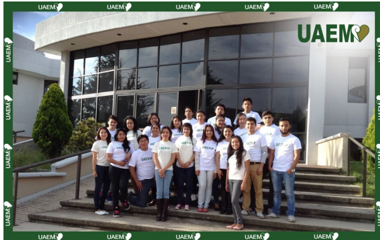
10. Alumnos de la Licenciatura en Actuaría en la Biblioteca Justo Sierra

En Valle de México habrá más que celebrar el próximo 17 de septiembre de 2015, día en que cumpliremos nuevamente otro aniversario, el número 19. Lo haremos con la vitalidad y la juventud de la comunidad de Valle de México, que siente el gran orgullo de pertenecer a la Universidad Autónoma del Estado de México. Así lo expresan sus alumnos con las sonrisas en su rostro y el nombre de su Universidad en su corazón.