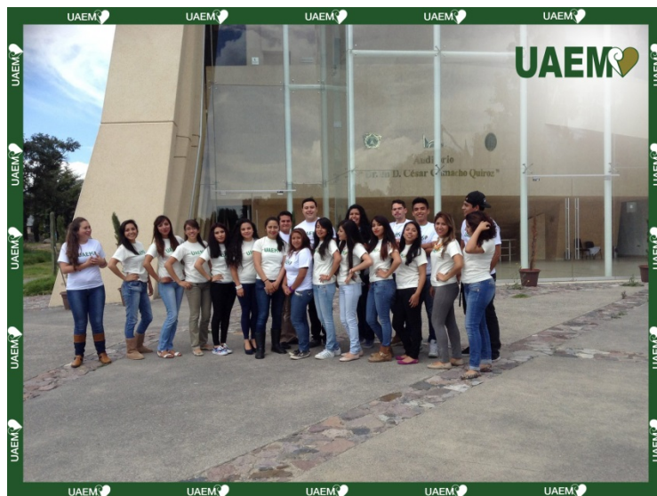
11. Alumnos de la Licenciatura en Relaciones Económicas Internacionales en el Auditorio