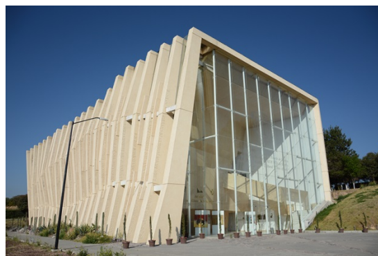
3. Auditorio "Dr. En D. César Camacho Quiroz"

Los aumentos de la infraestructura han marcado los diferentes símbolos utilizados para representar a la comunidad de Valle de México. Uno de los primeros símbolos, cuando aún era la Unidad Académica Profesional Valle de México, fue el que se basó en la Biblioteca Justo Sierra, que contenía los siguientes elementos retomados de la tradición de la UAEM: una cornisa triangular que significa estabilidad y confianza; dos torres que son Atalayas levantadas sobre el campo fértil del saber; los colores institucionales, verde y oro. El siguiente símbolo, diseñado en color verde, se inspiró en la obra escultórica de la Cafetería y Auditorio al aire libre; el Pabellón Universitario. Con sus trazos estilizados, este símbolo dibuja la blanca estructura metálica aerodinámica, cubierta por su blanca lona monumental. Actualmente el símbolo de Valle de México deja ver la forma del nuevo Auditorio Libro Abierto, por lo que presenta la parte frontal del edificio con su gran ventanal, y en perspectiva en el lado izquierdo, las placas de concreto, que evocan las páginas de un libro, sobre el segundo ventanal.