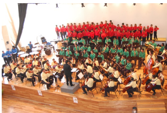
1. Concierto de la Orquesta Esperanza Azteca en el Auditorio Libro Abierto